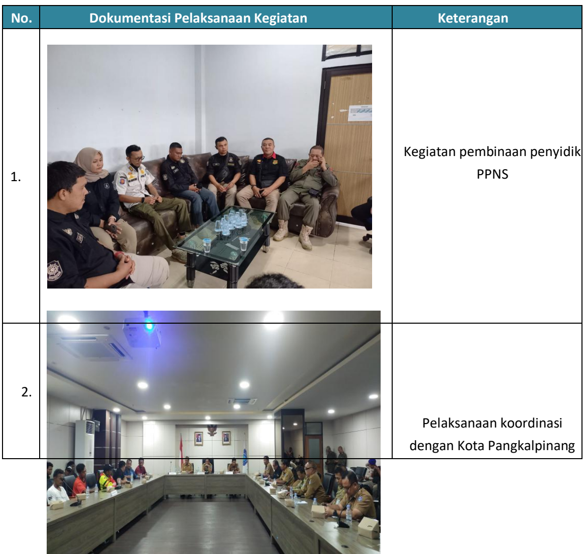
Gambar III.1 Kegiatan Penanganan Gangguan Ketentraman dan Ketertiban Umum Lintas Daerah Kabupaten/Kota dalam 1 (satu) Daerah Provinsi