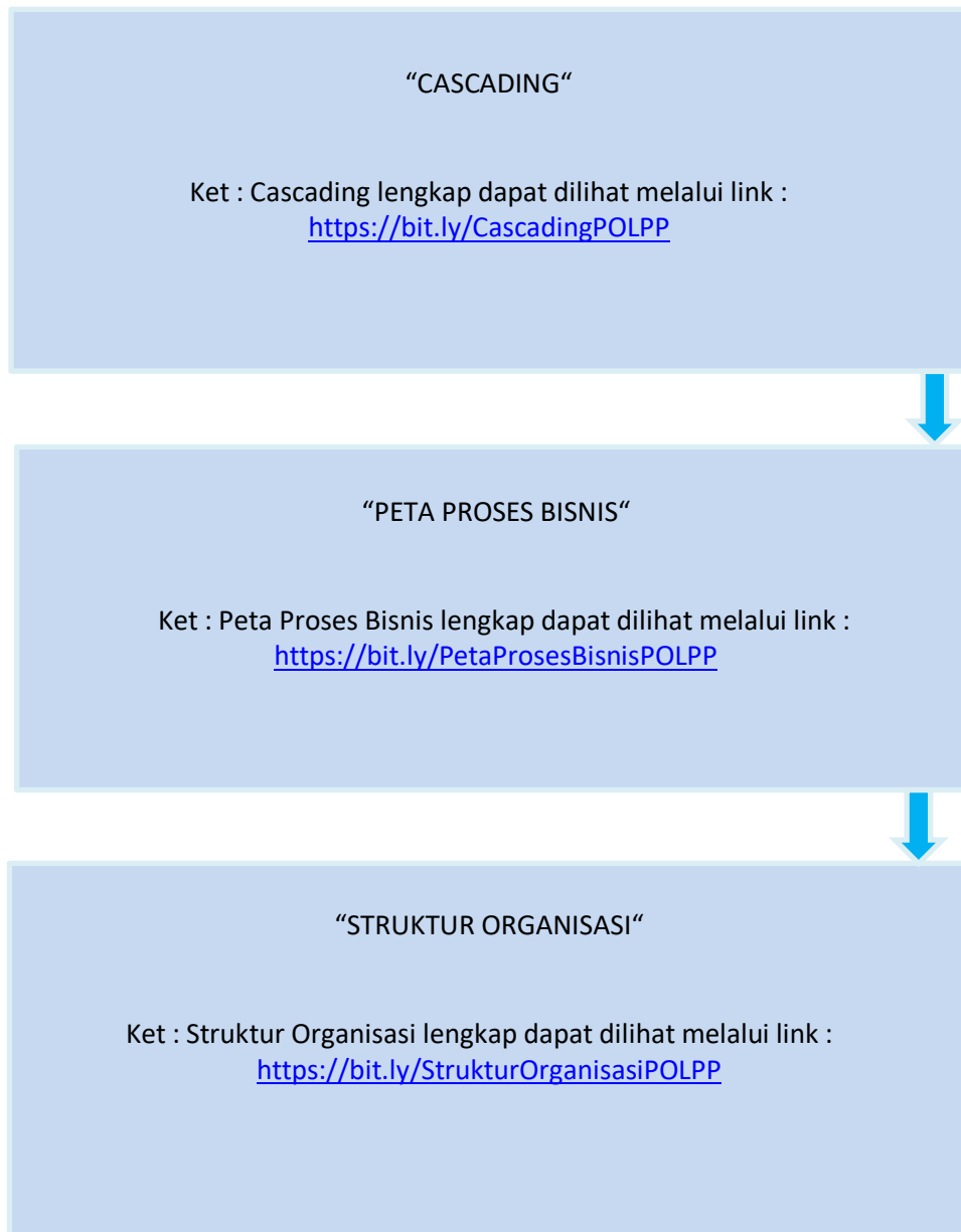
Gambar I.1 Cascading Kinerja, Peta Proses Bisnis dan Struktur Organisasi (halaman ini dapat di buat landscape)